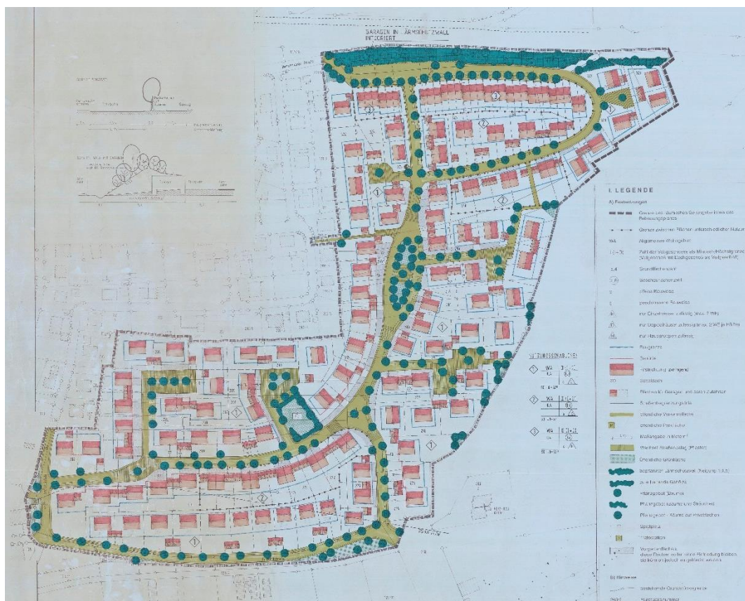
Bebauungsplan Rohäcker, „Urfassung“ von 1996

Für das Baugebiet „Rohäcker“ besteht ein rechtskräftiger Bebauungsplan aus dem Jahr 1996. Entlang der Friedhofstraße wurde bereits teilweise eine Bebauung realisiert, ohne dass jedoch mit der Erschließung dieses Bauabschnittes begonnen wurde. Bereits vor Rechtskraft des Bebauungsplanes hatte das Anwesen Friedhofstraße 5 bereits Bestand.