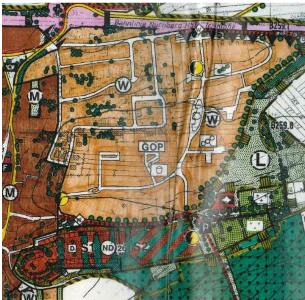
Auszug aus dem rechtswirksamen Flächennutzungsplan der Gemeinde Henfenfeld

Durch die Teilaufhebung des Bebauungsplanes ergeben sich somit keine negativen Auswirkungen auf das Landschaftsbild, den Naturhaushalt oder für den Artenschutz. Es ist davon auszugehen, dass die Flächen bis auf weiterhin landwirtschaftlich genutzt werden.